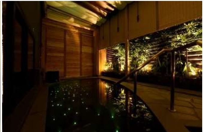
<安心お宿 ギャラリー>