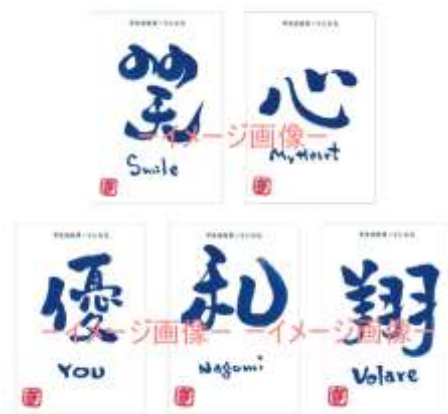
～ポストカードイメージ画像～