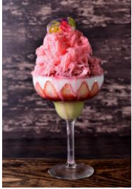
・ 苺とピスタチオ 1,480円

「メパフェ」と「かき氷」を組み合わせた新メニューの「パフェスノー」。かき氷に使用する氷は、ミルクで味付けしたものを採用し、ほんのり甘味がついた味わい。氷は細かく薄くフワフワに削り、口に入れた瞬間から優しく溶けていく、粉雪のような食感に仕上げています。パフェ仕様の器で、見た目も美しい大人なかき氷を目指しました。