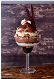
・ チョコレートと マスカルポーネチーズ 1,380円

濃厚な甘みのマンゴーと、さっぱりとした酸味のヨーグルトを組み合わせたメニュー。マンゴーをふんだんに使用し、見た目も華やかな一品。