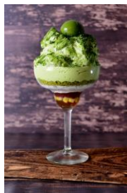
・ 京都宇治抹茶 1,280円