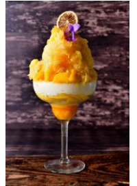
・ マンゴーとヨーグルト 1,480円

香り高いロイヤルミルクティーのスノーアイスにタピオカとレモンのムースをトッピング。