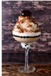
・ タピオカロイヤル ミルクティー 1,280円

ふんだんに使った苺とピスタチオのコンビネーション。エディブルフラワーを閉じ込めたゼリーがアクセントのキュートな一品。