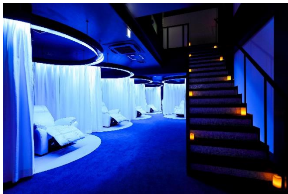
「宇宙」をイメージした内装