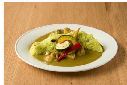
ワニカレー/コウニカレー 税込1,000円/700円 2匹のイリエワニをモチーフにした、ほうれん草カレー。