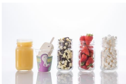
ミックスジュースアイスバー 税込410円 ミニカバ「モトモト」と「フルフル」をモチーフにしたミックスジュース味のアイスバー。