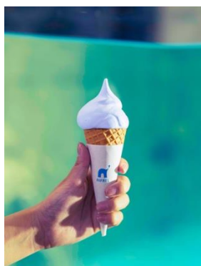
ニフレソフト 税込350円 ニフレロゴの水滴をイメージ。