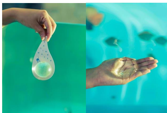
”水にふれる” 食べる水 税込250円 ニフレの名物、「食べる水」