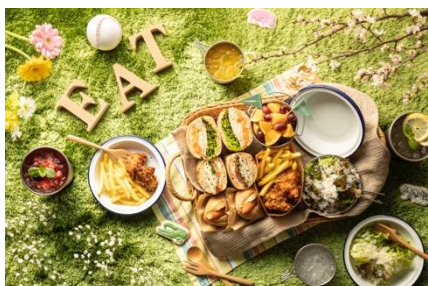
ピクニックセット 税込4,000円 みんなでシェアするドリンク付きのサンドイッチバスケット。