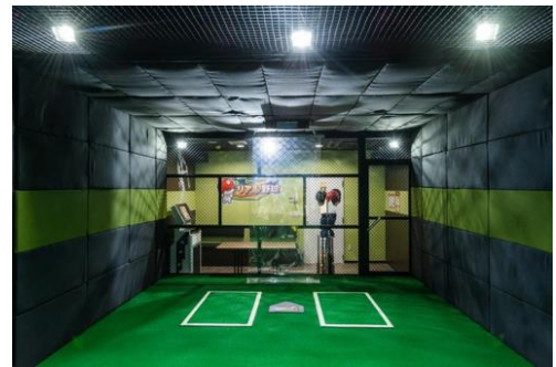
24平方メートルあれば野球空間に