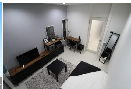
モデルルーム（イメージパース）

スマートロック機能は室内だけでなく、エントランスや勝手口等の共用部にも設置しており、スマートフォンを使って開閉が可能です。全てのIT機器は大崎電気工業株式会社の製品を使用していますが、全て同社の設備で動かせる学生向けマンションは全国初です。今後、当社提供の入居者サポートアプリとの連携も予定しています。