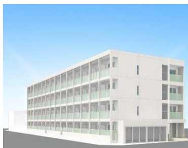
「フローライト小若江」外観イメージ