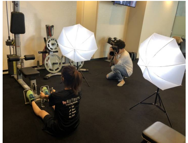
プロカメラマンがインスタ映えする構図で撮影します

単に脂肪を減らすだけでなく、メリハリのある筋肉を付け、「筋スタ映え」写真をインスタグラムにアップしていただくことで、トレーニングのモチベーションアップにつながると考えております。