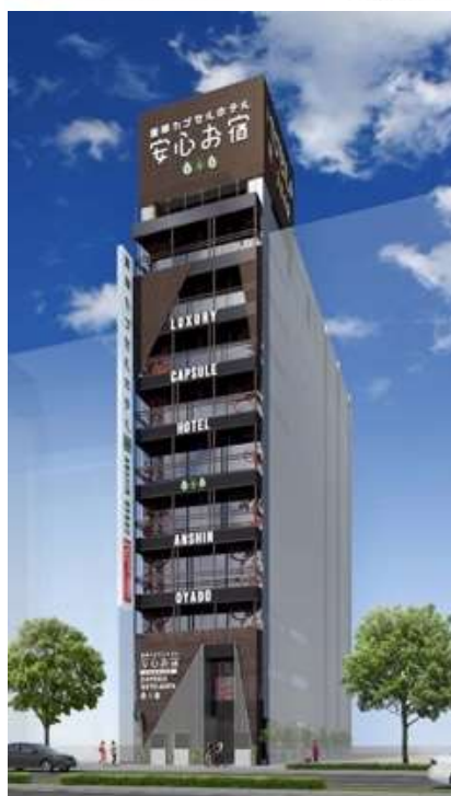
＜豪華カプセルホテル安心お宿 名古屋錦3丁目店（仮称）完成予想外観パース＞