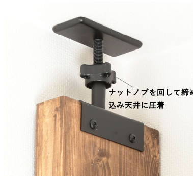
2×6材に取り付けたCシリーズ (アジャスター、トップキャップ)