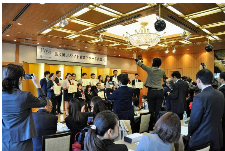
「ホワイト企業アワード」授賞式の様子

一般財団法人日本次世代企業普及機構(所在地:大阪府中央区、通称「ホワイト財団」、事務局:株式会社ソビア)は、2019年3月14日（木）に、日本で最も素晴らしいホワイト化の取り組みを行っている企業を表彰する「ホワイト企業アワード 2019」を開催するにあたり、2018年10月15日（月）～2019年1月31日（木）までエントリーを受け付けています。