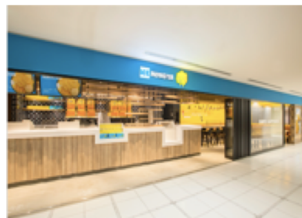
ICE MONSTER NAGOYA LACHIC

住所:名古屋市中区栄3-6-1 ラシック B1F 電話番号:052-241-6888 営業時間:11:00-21:00 (L.O. 20:30) 定休日:施設に準ずる 席数:47席