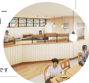
※座間店のイメージです

いたしました。こだわりぬいた特製パンは毎朝発酵させて店内で焼き上げ、150円～420円のお手頃な価格帯で、約50種類のコッペパンメニューをラインナップするほか、おそうざいの単品販売で晩御飯やお弁当需要にも対応いたします。また店内にはイートインスペースを設置し、30～40代女性をコアターゲットに、ファミリー層や男性にも幅広くご利用いただける店舗を目指してまいります。