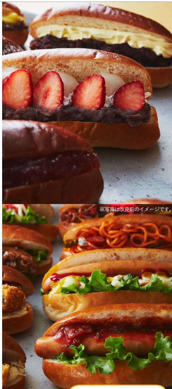
※写真は改良前のイメージです。