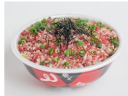
十勝牛とろ丼 「牛とろ丼（レギュラー）」 （¥880）