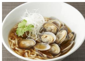
くそオヤジ最後のひとり 「あさをふんだんに使った くそオヤジメの一杯」（¥850）