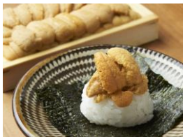
サクラBAR 「うにぎり」 （¥800）