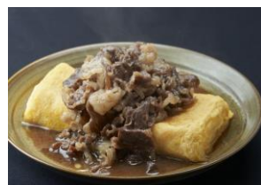
塩干 しおから 「和牛 肉だし巻き」 （¥800）