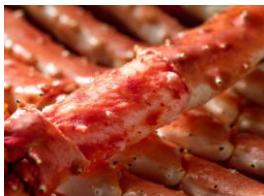
大洗 かに専門店 かじま 「本たらば蟹丸ごと一本焼き」 （¥1,500）