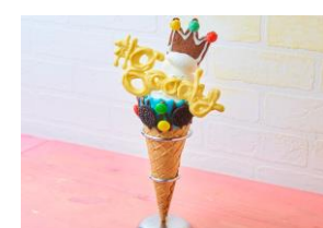
#goody Icecream&Lemon-Aid 「goody King」 （¥800）