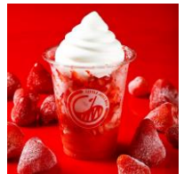
札幌リトルジュースバー 「いちごけずり®」 （¥500）