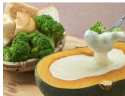
CJ Dining 八百屋 「まるごとかぼちゃのチーズフォンデュ」 （¥900）