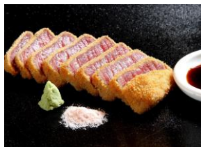
牛かつ勝昌。～花殿 ka-den～ 「近江牛かつ」 （¥1,800）