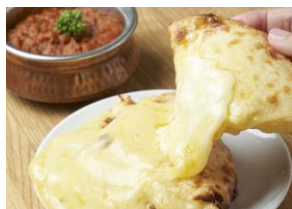
カトマンドウカレーPUJA 「とろ〜りチーズナン&三田ポークの キーマカレーセット」（¥800）