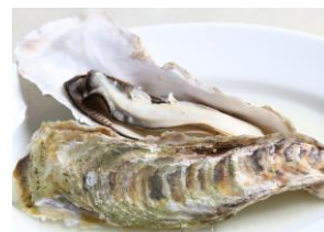
ガンボ&オイスターバー 「蒸し牡蠣」 （¥400）