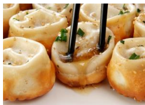
王府井（ワンフーチン） 「焼き小籠包」 （¥600）