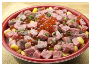
にくらや黒銀 「神戸ビーフにくら丼」 （¥1,500）

※価格は全て税込み価格です ※出店者・出店メニューについては変更することがあります