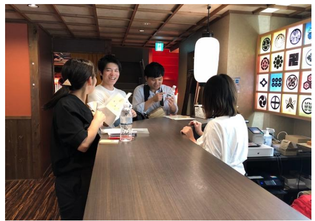
謎解きをする様子