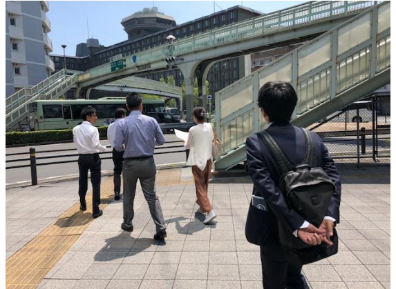
京都駅周辺を周って謎を解きます