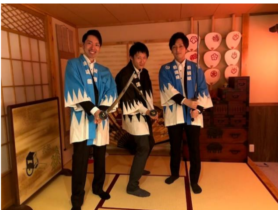
謎解きの中で和装体験も