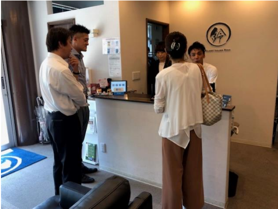
レセプションで謎を受け取ります

京都にある町家の宿「鈴（りん）」。 京の風情を再現した宿で至福のひと時を過ごす為、 レセプションでチェックインした所、渡されたのは、 部屋の鍵ではなく、京都のある場所が記された地図、 そして謎の暗号が書かれた古書だった。 そしてスタッフから衝撃の一言 「この謎を解かなければ、本日は野宿して頂きます。」 突然のことに驚いたが、面白そうだ。そう感じたあなたは 京のまちへと謎解きの冒険の旅に出かけるのであった。