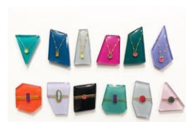
○△□ (from TOKYO) ※アクリルのアクセサリー