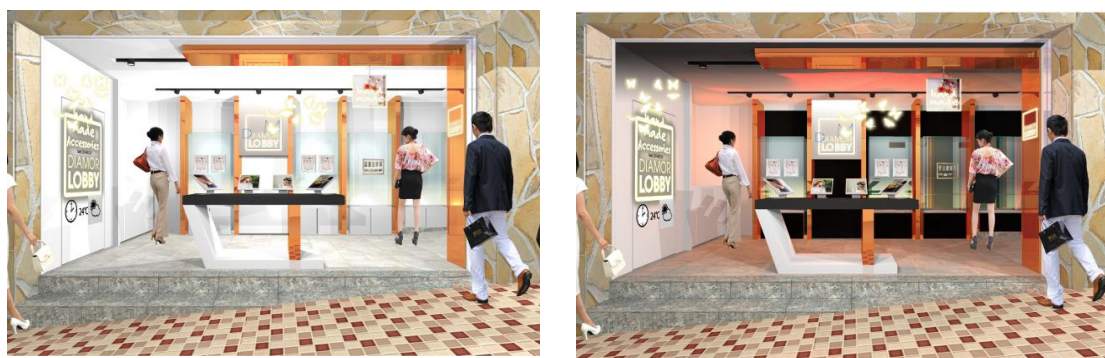
調色ベースライトや壁面ロールスクリーン、プロジェクターにより内装の印象を出店テナント様に合わせ変更可能