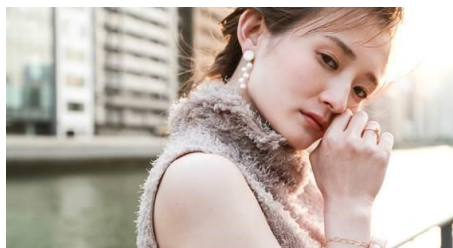
【u i .】ウイ（from OSAKA）

「日常にさりげないアクセントを・・・」 どんなシーンでも使いやすく身につけたときちよつとワクワクするアクセサリーをつくっています。 ui.のアクセサリーは世界でたった一つの美しい天然石を使用しています。天然石のひとつひとつに、色、形に個性があるので、一点物としてのオリジナリティ溢れるデザインが特徴です。