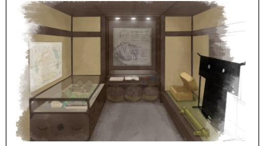
ギャラリーイメージ

幕末に大政奉還を実現させた立役者、後藤象二郎（土佐藩重役）のいた寓居跡に、記念ギャラリーを開設します（平成30年6月1日）。その概要を紹介します。