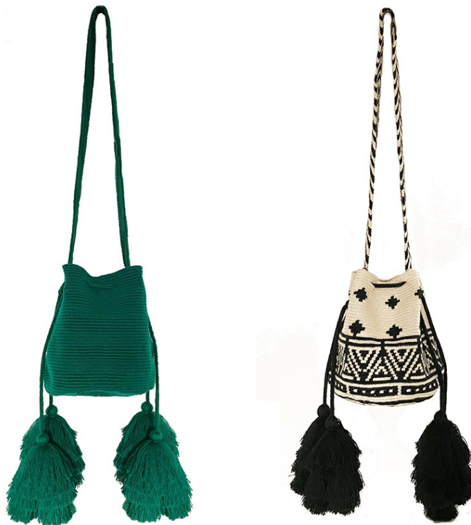
FRAY I.D × CHILA BAGS

これからの時代をリードしていくスタイリングデザインをコンセプトに掲げファッション感度の高い女性から高い支持を得ているFRAY I.DがCHILA BAGSのコラボレーションバッグを販売開始！