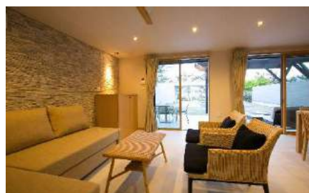
アジアンテイストな内装