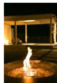
特別な空間を演出する エタノールファイアー