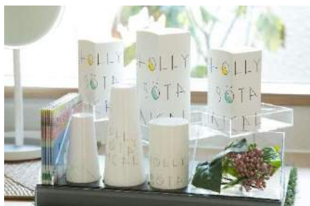
ハーブを主成分とした 『ホーリーボタニカル』を アメニティに使用

メッツォ オールスイート ヴィラズは、女性に人気のコスメメーカー『Mezzo』と『マリントピアリゾート』のコラボレーションにて誕生。ホーリーバジルを基本とする天然ハーブを使用したコスメをアメニティに採用し、プライベートプール、天然温泉、屋外ジャグジーも配した身も心も喜ぶ宿をコンセプトにしております。