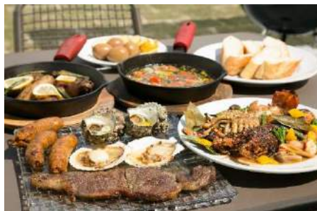
ハーブとの相性抜群な アジアングランピングメニュー