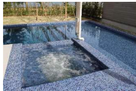
屋外ジャグジーを配置