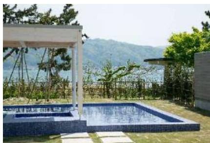
客室から見えるオーシャンビュー