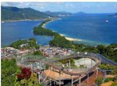
天橋立から徒歩圏内の希少な立地

ヴィラの外観、内装、家具にいたるまで、東南アジアのリゾート地を彷彿させるアジアンテイストな造りとなっており、日本にいながら非日常の空間でリゾート気分を味わっていただけます。