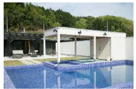
全室プライベートプール付き