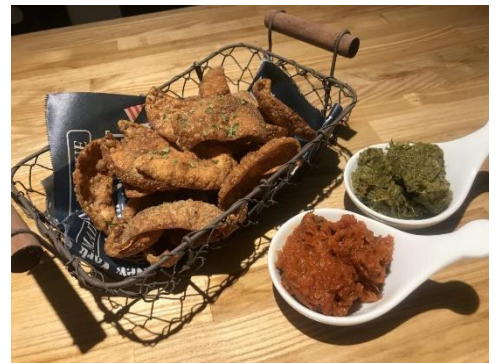
業界初！塗って食べる「ぬる餃子」

そのほか、餃子餡をテリーヌ状にした「餃子のテリーヌ」(600円)、餃子餡で作ったソースをかけて食べる「オレギョ流チキンライス」(900円/チキンライスとスープ、餃子の半分サイズがワンセット。ランチタイムのみ提供)餃子の餡を練りこんだ「ポテトサラダ」(280円)など、餃子の新しいスタイルを提案する、進化系餃子メニューを取り揃えます。