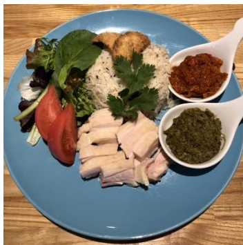
オレギョ流チキンライス

自家製味噌で食べる、神戸スタイルの「焼餃子」(にんにくあり/なし 共に330円)、レモン塩で食べる「しそ餃子」(390円)など、定番メニューのほか、ヘルシーバターオイル「ギー」で贅沢に仕上げた「4種のキノコとバターの餃子」(420円)、生姜をふんだんに使用した「生姜の餃子」(330円)などの変わり種餃子も提供いたします。ガツンとしたにんにくの風味を味わいたい方には、「にんにくダブル」(360円)「にんにくトリプル」(390円) にんにくフォース(420円)「ロシアンガーリック」(450円)と、4段階の餃子をご用意しております。ドリンクは、自然派ワイン常時15種類を中心に、関西では導入店の少ないキリントップマルシェを設置し常時4種類のクラフトビールを提供するなど、約50種類を提供いたします。 ※価格は全て税抜きです。