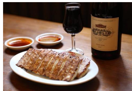
自然派ワインに合わせて