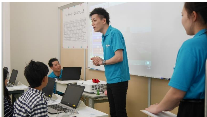
体験授業の様子（プロスタキッズ 生駒校）

2020年、小学校では「英語教育の早期化」「プログラミング教育必修化」、中学校では「英語授業の英語化」「英単語取得目標数の増加」、高校では「大学入学共通テストの導入」「英語の民間資格、検定試験の導入」が実施され、教育が大きく転換します。しかし、保護者の半数以上がその内容を知らないと答えるほど、認知が遅れているのが実情です。1977年奈良で創設以来、一貫して「人間大事の教育」という企業理念に基づき、「社会で求められる力」を育むことを目指してきた当社は、2020年からの学校教育に順応できるように塾の授業改革を行い、4月から14教室でオンライン英会話「KEC online 英会話」を導入、プログラミング教室「プロスタキッズ生駒校」を開校いたします。