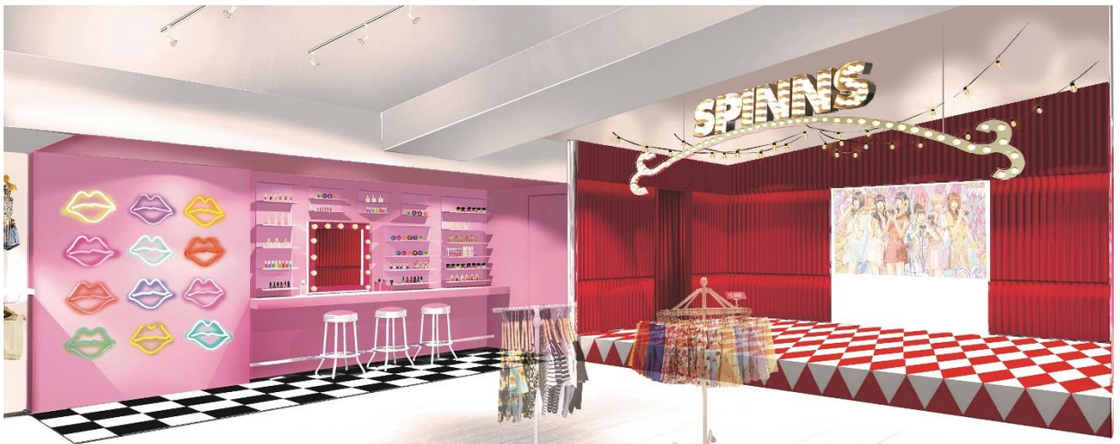
ネオン×ピンクを基調とした店内

6つの「テーマ試着室」が新登場！レディース4室・メンズ2室用意しております※写真はイメージです