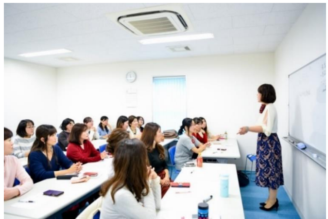
真剣に話を聞く受講生ら