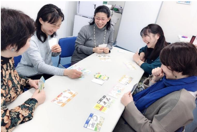
「受精！」と叫んで盛り上がる受講生ら

https://peraichi.com/landing_pages/view/panthunokyousithu