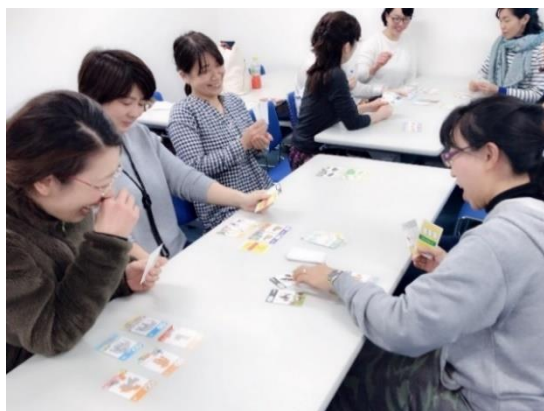
性教育カードゲーム時に「受精！」と叫ぶ受講生ら

性をタブー視しながらも、日々様々な情報が溢れ、リベンジポルノなどの犯罪リスクも増えてきた昨今の状況を見かね、子どもを守るために母親が立ち上がりました。当協会では、家庭での性教育を提案する「とにかく明るい性教育 パンツの教室」の講座を展開しており、関西初の講座を3月10日(土)に開催します。