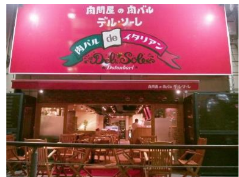
「デル・ソーレ道頓堀」の外観