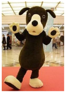
なんばワンが神父で登場

完成式では「お花の教会」で模擬挙式を実施します。新郎・新婦役は、ブライダル学科プランナーコースに在籍する学生が、神父役には、なんばウォークのマスコットキャラクターである「なんばワン」が登場します。