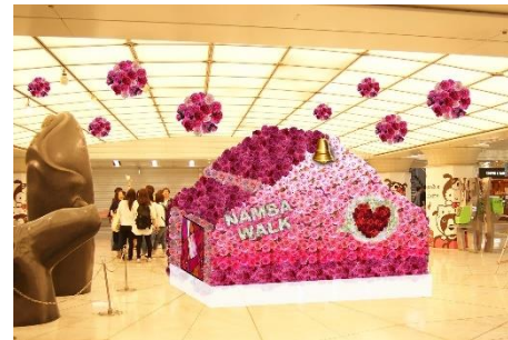
「お花の教会」パース写真

ひとつひとつに思いを込めて作り上げられる作品です。来街者の皆様にご覧いただき、幸せな雰囲気をお届けできればと思っています。