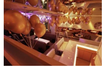
「マジック イン ワンダーランド」店内の様子