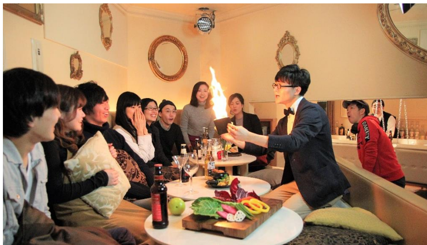
お客様の前で手品を披露します

メニューブックに☆が記載されており、最高難度は☆5つ。メニューのグレードが上がると、トリックの難易度もどんどん高くなります。見事、☆5つのスペシャルマジックを見破ると、該当メニューが無料になるだけでなく、お店にいらっしゃるお客様全員にスペシャルドリンクを一杯、無料でふるまいます。