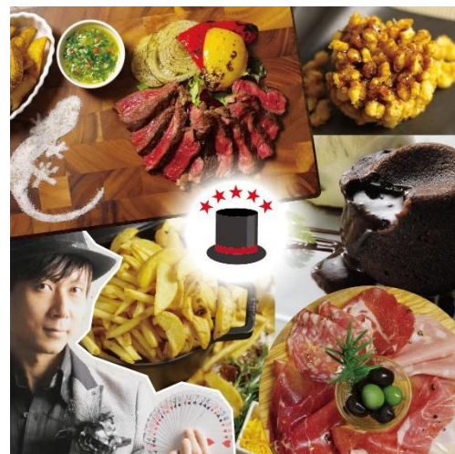
「マジックマーク」対象メニュー