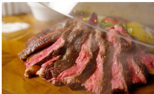
難易度☆5「米国産1ポンドステーキ」（税別3,500円相当）