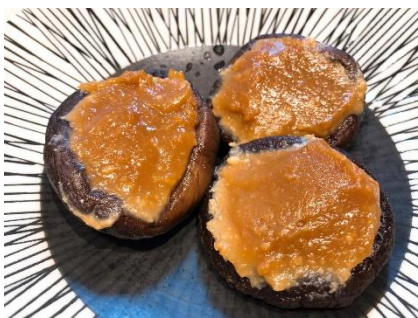
干し椎茸の自家製味噌詰め

発酵食品は、それぞれ菌の種類が異なるため、数種類を重ねることでより多くの菌を取り入れることができます。当店といたしましては、摂取することで、免疫力を高め、より健康になって欲しいと思っております。