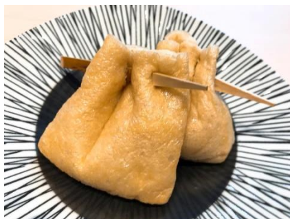
酒粕入り揚げ巾着