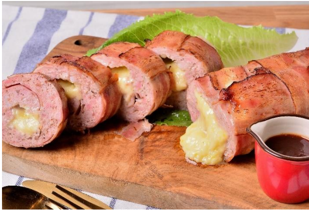
・ベーコン・エクスプロージョン 通称：ベーコン大爆発 (1,580円)

メニュー数はフード約50種類、ドリンク約100種類。肉をメインにしたキャンプメニューを豊富に揃えております。女子には嬉しい「コールスロー」が食べ放題で、キャンプには欠かせないカレーや、流行りのダッチオープン・スキレットメニューまで仲間とわいわいできるメニューを提供します。※価格は税抜きです。