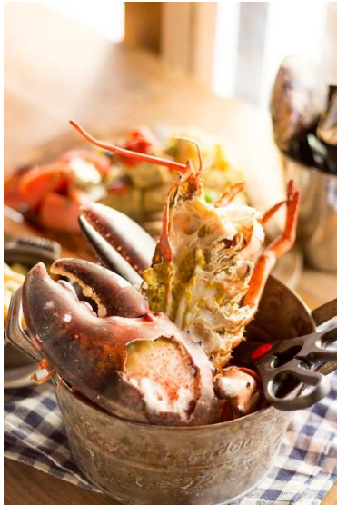
・オマールエビのバケツ盛り (1,880円)