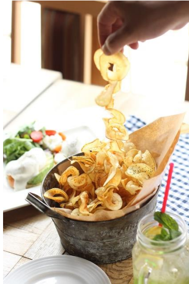
・リボンフライ (580円)