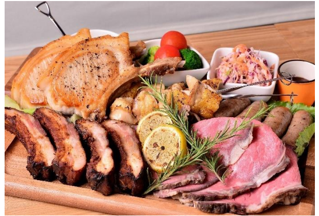
・グリルド ミートプラッター (レギュラー=2,800円、メガ=4,800円)