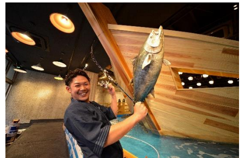
東の間の漁師気分をお楽しみください

店名：ジャンボ釣船 つり吉 住所：大阪府大阪市浪速区恵美須東2-3-14 電話番号：06-6630-9026 営業時間：11時～23時（L.O 22時） 店舗面積：約700平方メートル 席数：200席 客単価：4,000円 水槽総水量：120トン WEBサイト： http://tsuri-kichi.com