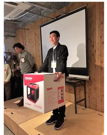
優秀賞には3Dプリンターを贈呈