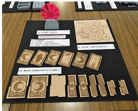
前回の「レーザー彫刻部門」受賞作