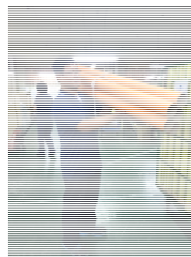
持ち運びのムダの事例

そこで私たちは2016年に、一般社団法人ダイエツト経営を立ち上げました。製造業・サービス業の管理監督者を中心に、現場にはびこるムダな仕事や作業を見つけ、生産性を高める知識や技術等の教育を、2017年より本格的に開始します。