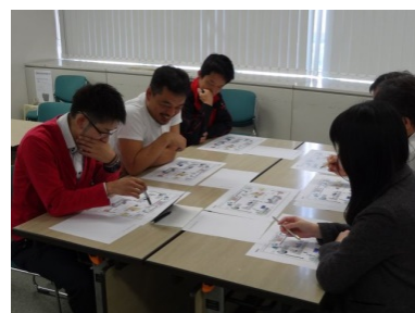
グループワークのまよう