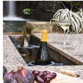
もてなしのプールサイドワインクーラー