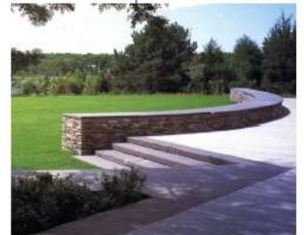
いろんな集いを生むロングベンチ