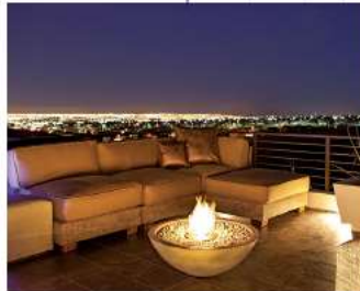
集いのひと時を焼き付ける火の演出