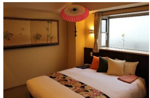
客室の一例。(開業準備中です)