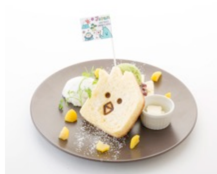
【日本】 HOPPERの小倉クリーム デニッシュサンド 1,290円 (税込)