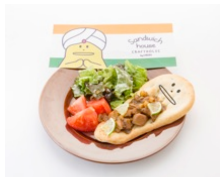
【インド】 KORATのタンドリーチキンと ヒヨコ豆サンド 1,280円 (税込)