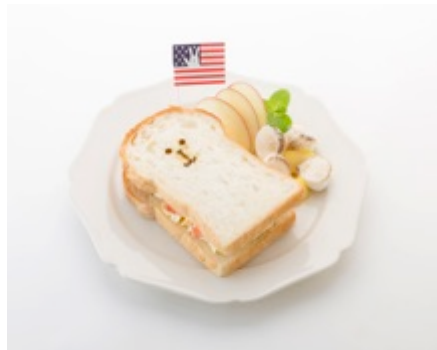
【アメリカ】 RABのフルーツサンド 1,360円 (税込)

日本やアメリカ、スウェーデン、イタリアなど6カ国のサンドイッチが登場！2月は、バレンタインらしく苺をメインにフルーツをたっぷり使用。目でも楽しめるキュートなラインナップ。