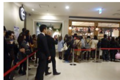
昨年の行列の様子