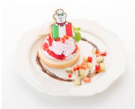
【イタリア】 SLOTHの摘みたて苺ジェラートサンド 1,780円 (税込)