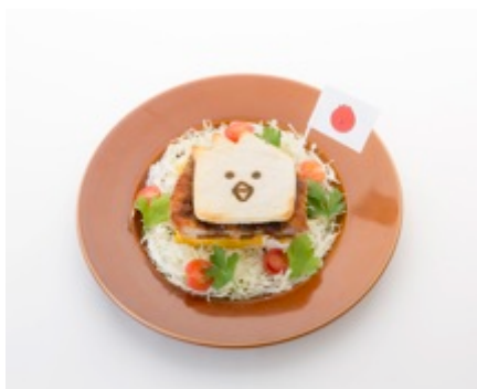
【大阪】 HOPPERの甘辛だれ関西風カツサンド 1,290円 (税込)