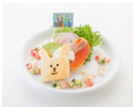
【ハワイ】 RABのスモークサーモンと ロミロミサラダサンド 1,490円 (税込)

3月の限定メニューは、日本の関西風カツサンドなど6カ国の食事系サンドイッチが充実。メキシコやインドなどのスパイシーなものから、ハワイのロミロミサンドなど本格的な仕上がり。