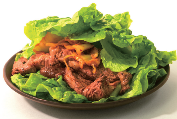
ステーキかぶりつきサンチュセットイメージ