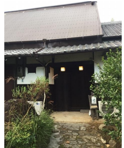
元そば屋！築100年の古民家を「学びの場」へ 今後は社員研修やカルチャー教室なども開催予定

1月22日に就職活動を控える大学3年生を対象に、古民家を寺子屋に見立てたインターンシップを代表自ら企画し開催いたします。一風変わった「寺子屋型インターンシップ」の様子をぜひご取材下さい。