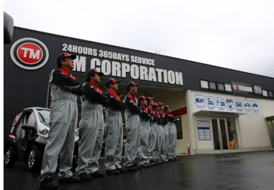
京都初！24時間365日営業の総合的なカーライフサポート拠点

当社といたしましては、24時間365日営業でお客様のカーライフをこれまで以上にサポート出来ればと思っております。