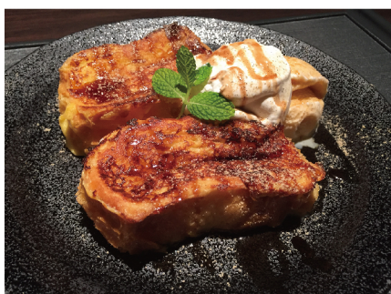
黒蜜きなこのふわとろフレンチバケット

「黒蜜や」では、黒蜜の原材料である「黒糖」を沖縄波照間産を仕入れ、組み合わせとなる「きなこ」は丹波産黒大豆を使用、また「抹茶」は、石臼で挽き新鮮さと色と香りに富んだ天然抹茶原料のみを使用した宇治抹茶など、それぞれの個性と調和を活かした食材を提供します。