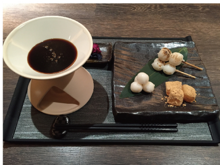
黒糖 100% の出来立て温かな黒蜜フォンデュ