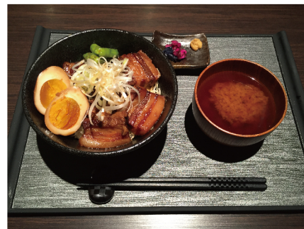
黒蜜でコクとろの豚角煮丼