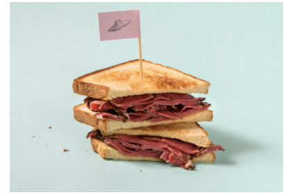
「ブルックリンパストラミサンド」