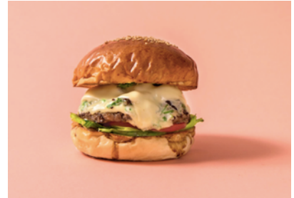
「九条ねぎ賀茂なすモzzarellaバーガー」