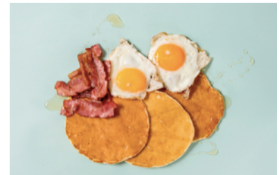
「オリジナル バターミルクパンケーキ」