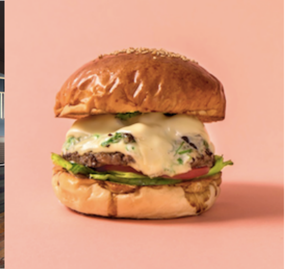
九条ねぎ賀茂なすモzzarellaバーガー

全国27劇場を展開する株式会社松竹マルチプレックスシアターズ(東京都中央区、代表取締役社長:秋元一孝)は、MOVIX京都南館2階に、モダンアメリカンダイナー『MOTION DINER KYOTO(モーション ダイナー キョウト)』を、2016年7月1日(金)オープンいたします。松竹マルチプレックスシアターズとしては初めて手がける飲食店です。