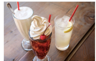
左「ミルクシェイク」、中「ダークチェリークリームソーダ」、右「自家製レモネード」