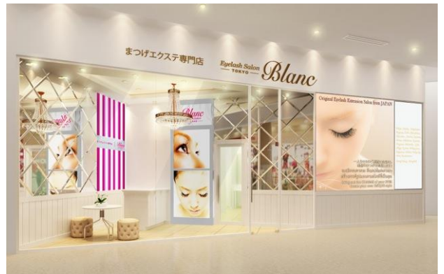
ベトナム ホーチミン店